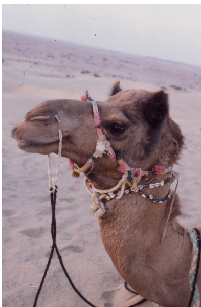
Michael Jackson, India